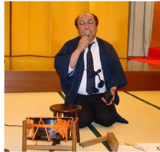
三木会員による 「元禄名槍譜 俵屋玄蕃」