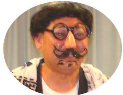
折式田会員の秘芸