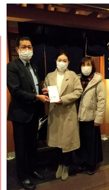
錦茶房にて奨学金支給並びに送別会

晩冬の候 ますますご健勝のこととお喜び申し上げます。今月は私の人生の中で重要な時期だと思います。1月中旬に修士論文を提出し、最終試験も終わりました。しばらくしてから学生生活に別れを告げ、新しい生活を始めます。卒業が近づいているため、学校や市役所、大家さん、銀行などで色々な手続きをしなければなりません。また、就職活動については、まだ試験時間が発表されておらず、受験できるかどうかはまだ分かりませんが、試験に向けて積極的に準備しています。いい成績が取れるように頑張っています。一日も早いコロナの終息と、皆様のご健康とご多幸をお祈り申し上げます。